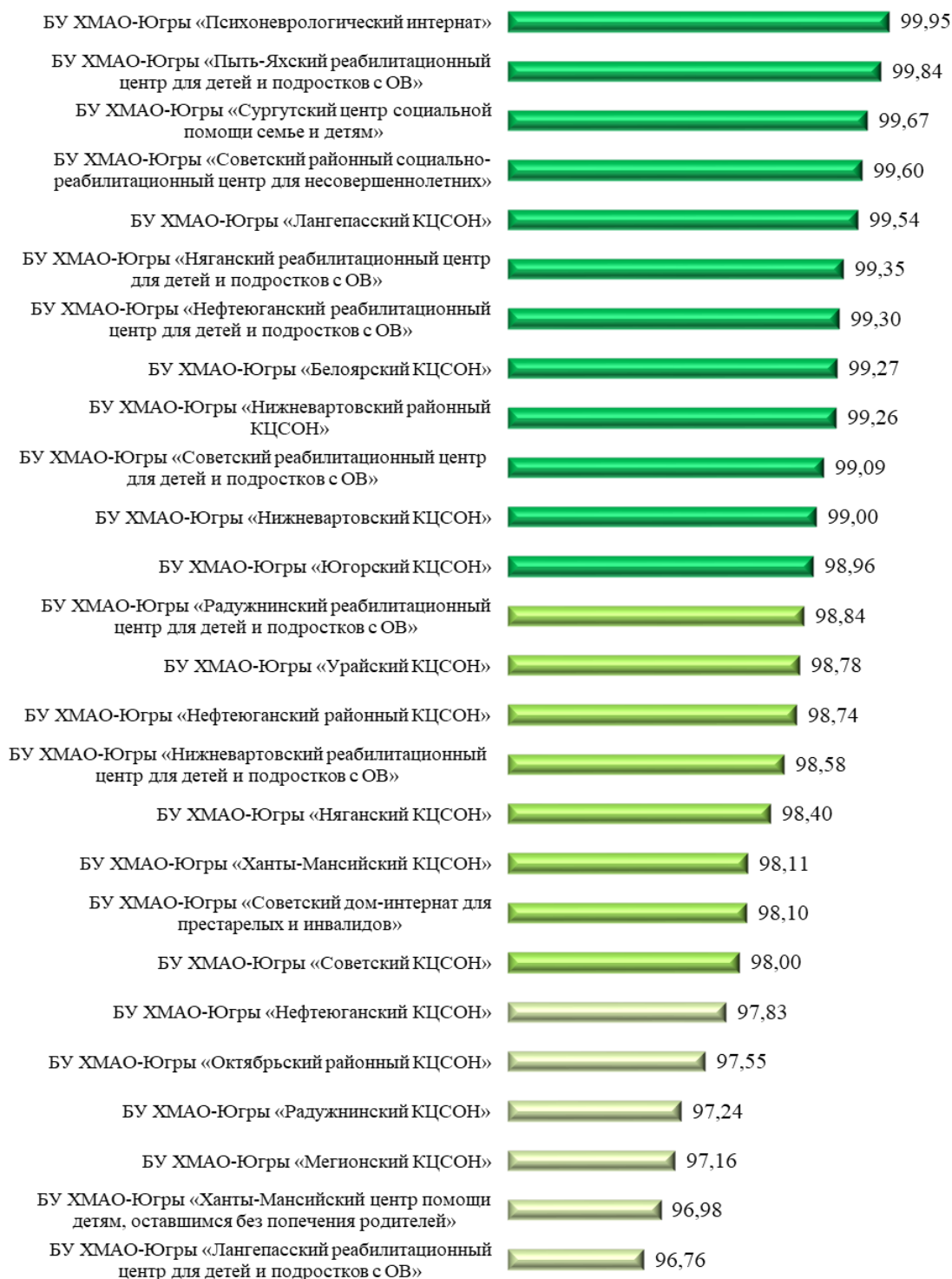
Рисунок – 1 Рейтинг организаций социального обслуживания ХМАО-Югры

По итогам проведения сбора и обобщения данных опроса получателей услуг и информации, размещенной на официальных сайтах организаций социального обслуживания ХМАО-Югры, получена оценка качества условий оказания услуг этими организациями. Итоговые значения по каждой из организаций социального обслуживания представлены на рис. 1: